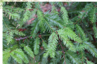
【センベルセコイア】 ヒノキ科 セコイア属 常緑針葉 高木

建物と人、建物とまち、人と人との縁をつなぐ。 自然と調和し、景色を創る。 自然と調和し、景色を創る。